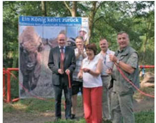
Feierlicher Banddurchschnitt für den neuen Wanderweg in die Döberitzer Heide.

Der Bau des Wanderweges war von Potsdam intensiv unterstützt worden, unter anderem mit 10 Arbeitskräften über die Arbeitsförderung.