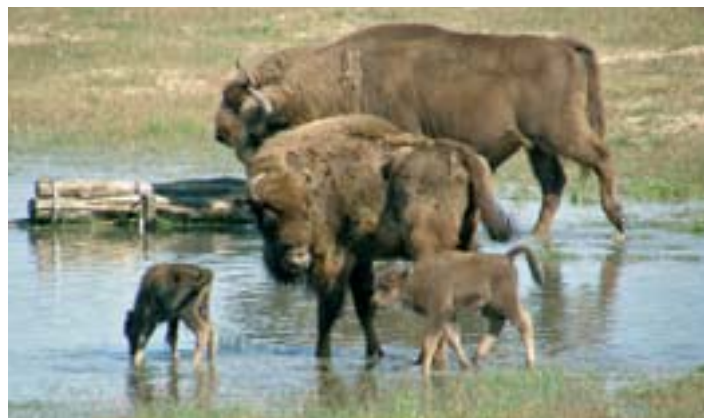
Baby-Boom bei Sielmanns Wisenten – schon zum dritten mal gibt's Nachwuchs im Schaugehege.