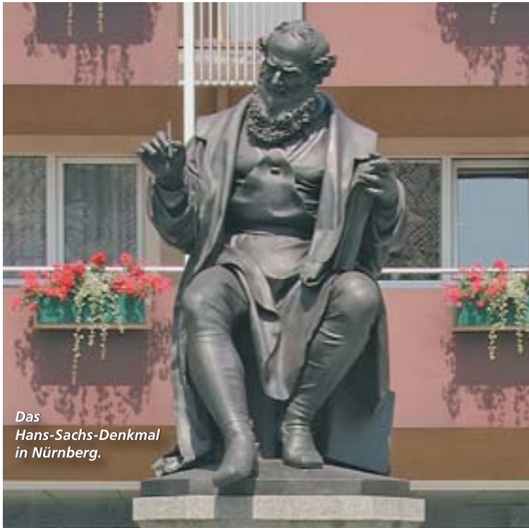
Das Hans-Sachs-Denkmal in Nürnberg.

Die Straße in der Brandenburger Vorstadt (Potsdam-West) hieß 1907 – 1945 Sigismundstraße, benannt nach dem Prinzen Sigismund (1864 – 1866), Sohn des späteren Kaisers Friedrich III. Sie ist heute nach dem Dichter und Meistersinger Hans Sachs benannt.